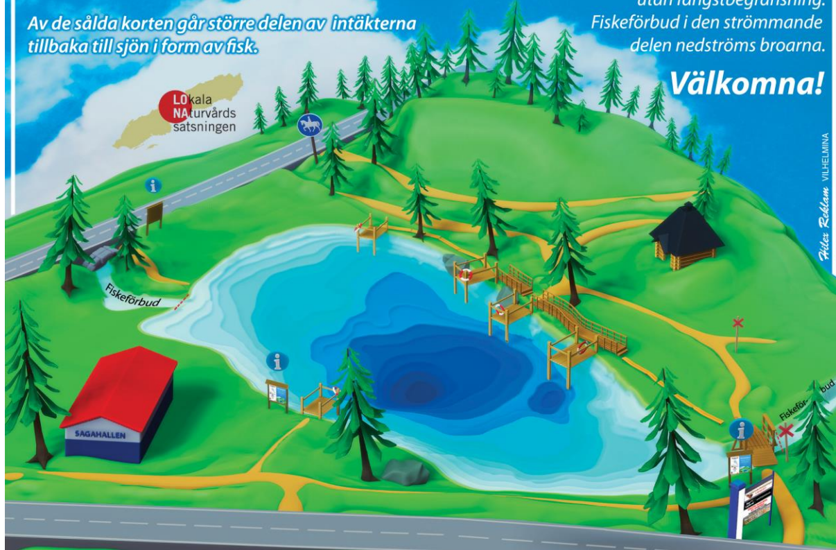
Skylt som visar området