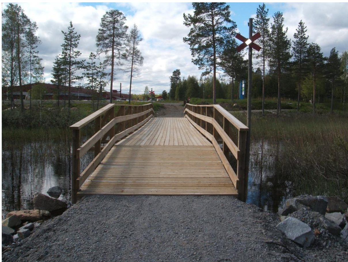
Gång och skoterbro över Baksjöbäcken

”Rekreationsområde Baksjötjärn” avser samarbete mellan Kultur- och utbildningsförvaltningen, Vilhelmina kommun samt den lokala skoterklubben och den lokala ridklubben.